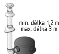
AKIT03 koaxiální vertikální odvod Ø 60/100